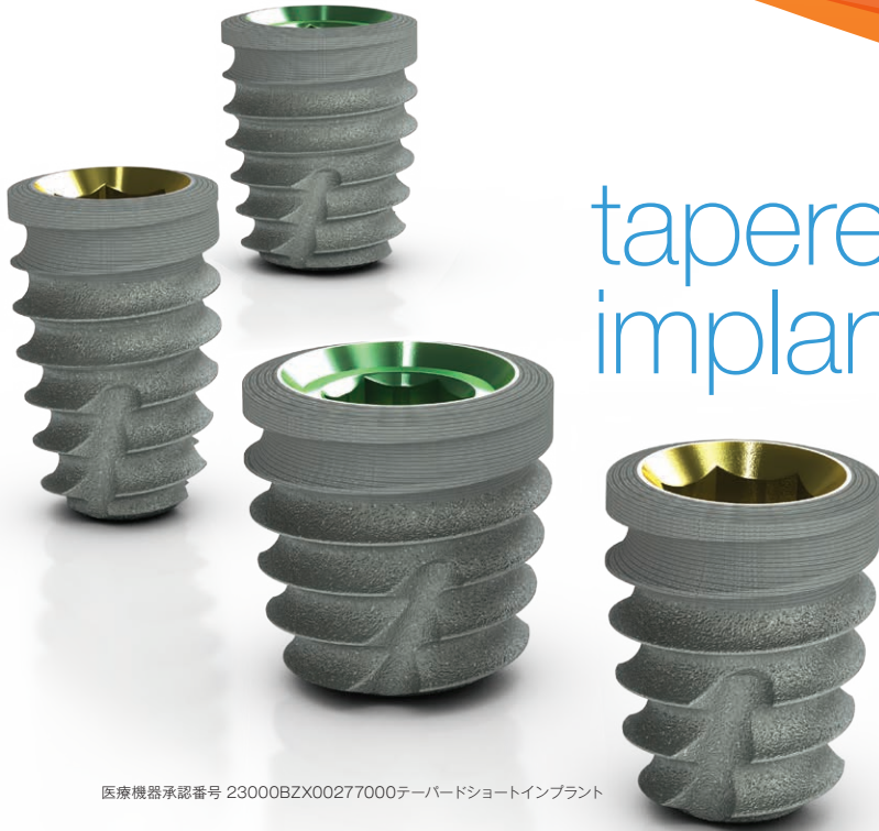
医療機器承認番号 23000BZX00277000テーパードショートインプラント